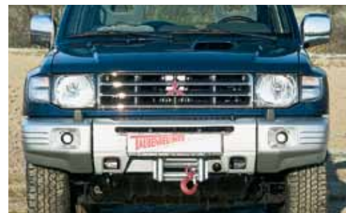
Mitsubishi Pajero V20