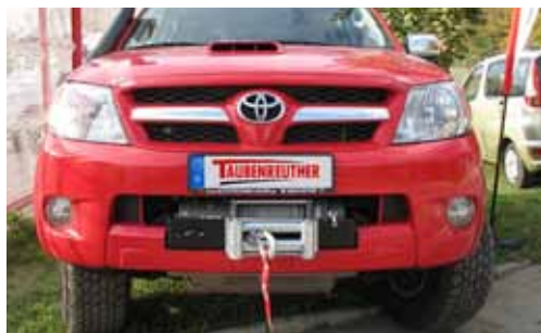
Toyota Hi-Lux New