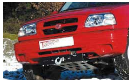
Suzuki Gran Vitara < 2005