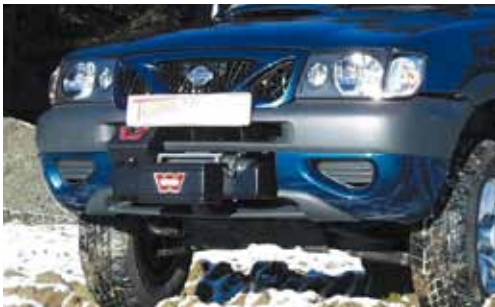
Nissan Terrano 2