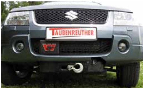
Suzuki Grand Vitara