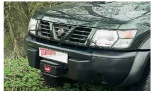
Nissan Patrol GR