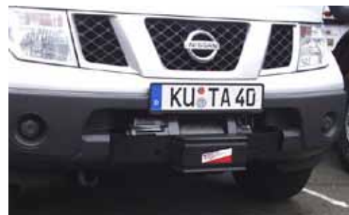
Nissan Pathfinder/Navara D40