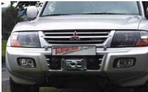
Mitsubishi V60 - V80