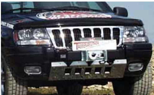
Jeep Grand Cherokee

Su richiesta, possiamo fornire svariati kit montaggio anche per i più popolari modelli americani (Chevrolet, Dodge, Ford e GMC).